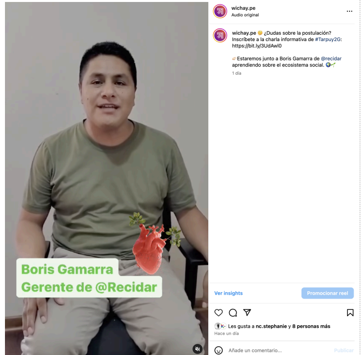
Post en Instagram